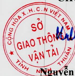
Nguyễn Văn Vinh